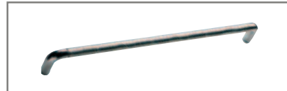
DI SERIE-STANDARD-DE SERIE-DE SERIE-STANDARD СЕРИЙНЫЕ Cromo - Chrome - Cromo Chrome - Chrom - хром