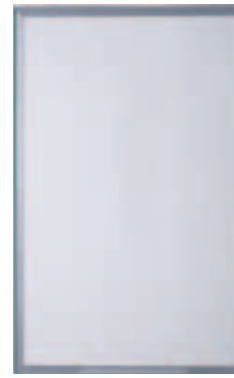
Jhon alluminio scotch bright Jhon aluminium scotch bright Jhon aluminio scotch bright Jhon aluminium scotch bright Jhon aluminium scotch bright Jhon aluminium scotch bright Jhon алюминий scotch bright