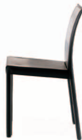
Sedia Liberty Liberty chair Silla Liberty Chaise Liberty Stuhl Liberty cрын Liberty