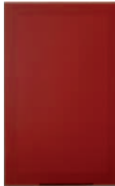
Xenon alluminio scotch bright Xenon aluminium scotch bright Xenon aluminio scotch bright Xenon aluminium scotch bright Xenon aluminium scotch bright Xenon Aluminium scotch bright Xenon алюминий scotch bright

VETRO - GLASS - VIDRIO - VERRE - GLAS - СТЕКЛО