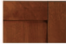
Ciliegio Manila Cherry Manila Cerezo Manila Merisier Manila Kirschbaumfarbe Manila Вишня Манила

FINITURE E COLORI - FINISHES AND COLOURS - ACABADOS Y COLORES FINITIONS ET COULEURS - FEINBEARBEITUNGEN UND FARBEN - ОТДЕЛКИ И ЦВЕТА