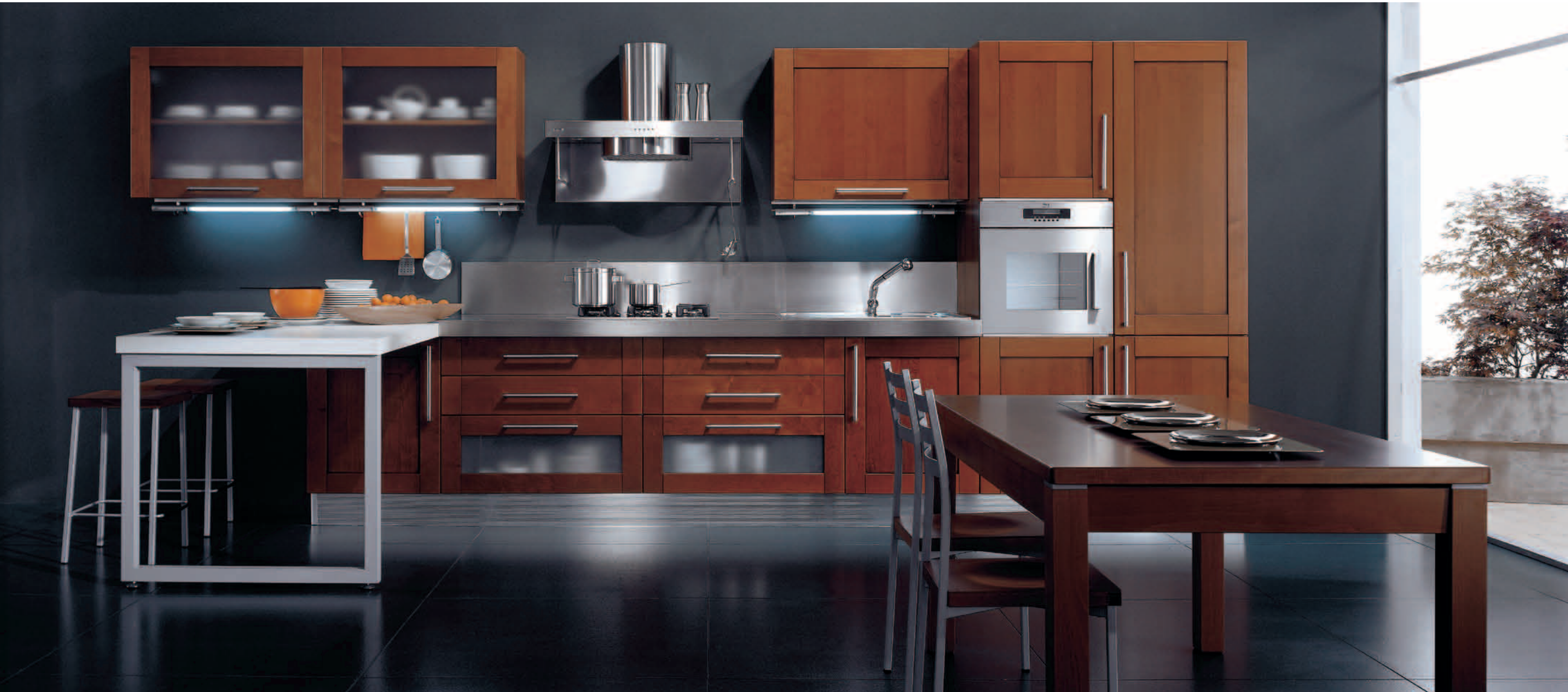
ciliegio Manila - cherry Manila - cerezo Manila - merisier Manila Kirschbaumfarbe Manila - вишня Манила