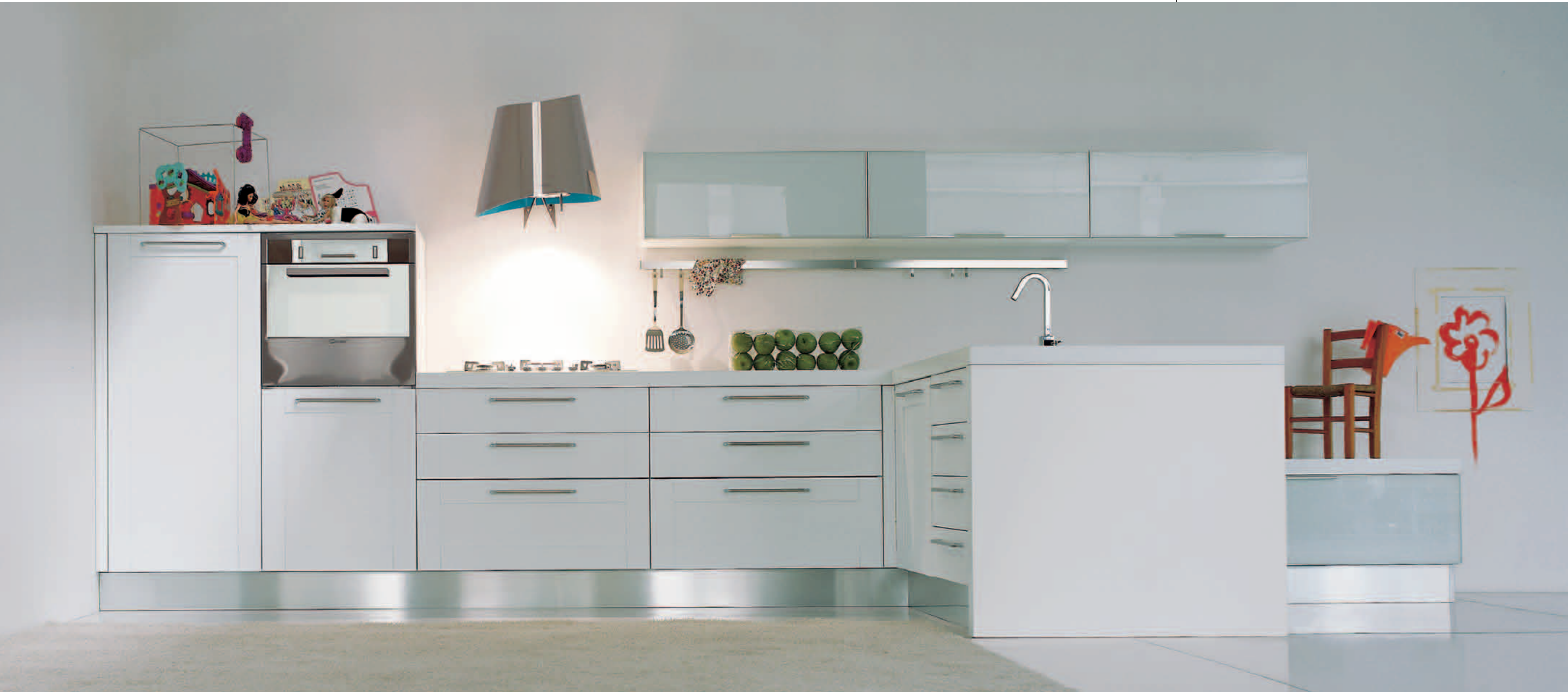
rovere bianco semilucido con vetri Xenon bianco - semi glossy white oak with Xenon white glasses - roble blanco semibrillo con vidrios Xenon blanco chêne blanc semi-brillant avec les verres Xenon blanc - Eiche Weiss glanz mit glasrahjm Xenon Weiss - белый полуглянцевый дуб и белые стёкла Xenon