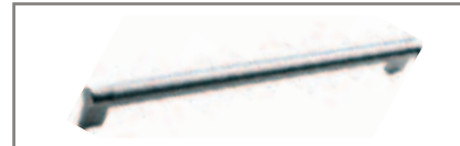
DI SERIE-STANDARD-DE SERIE-DE SERIE-STANDARD СЕРИЙНЫЕ Nichel - Nichel - Niquel Nickel - Nickel - Никель