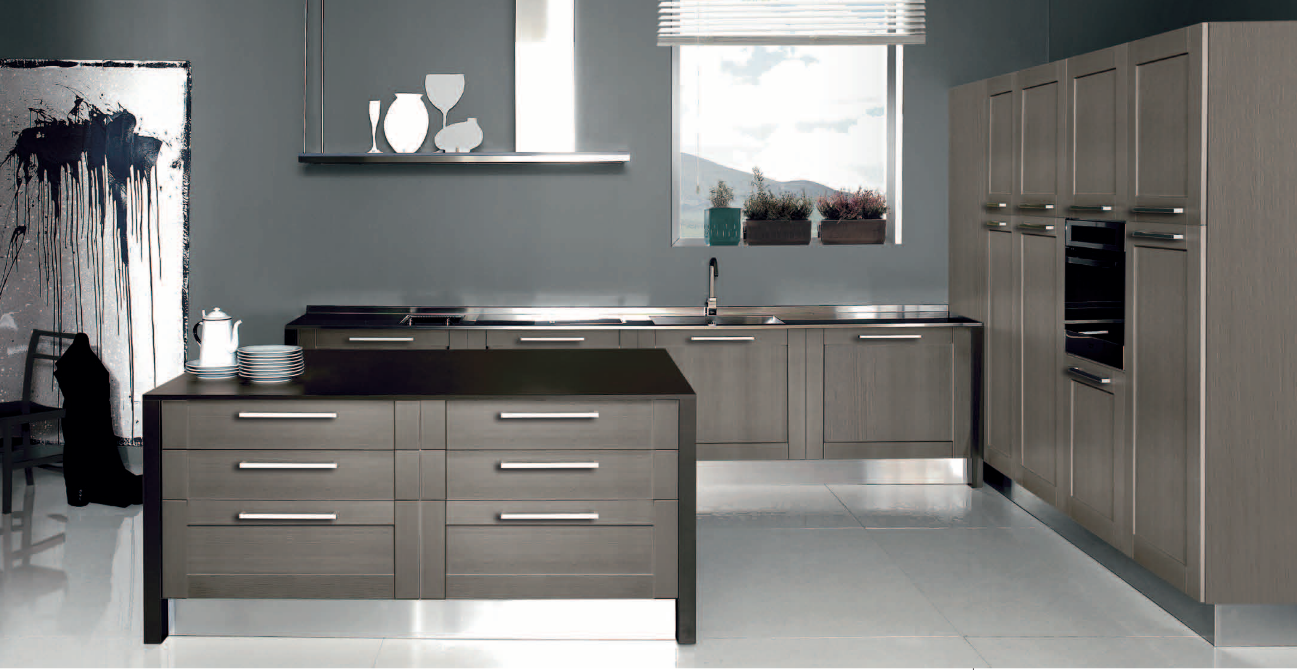
Rovere cenere - Ash oak - Roble ceniza - Chêne endre - Eiche Asche - дуб маранелло