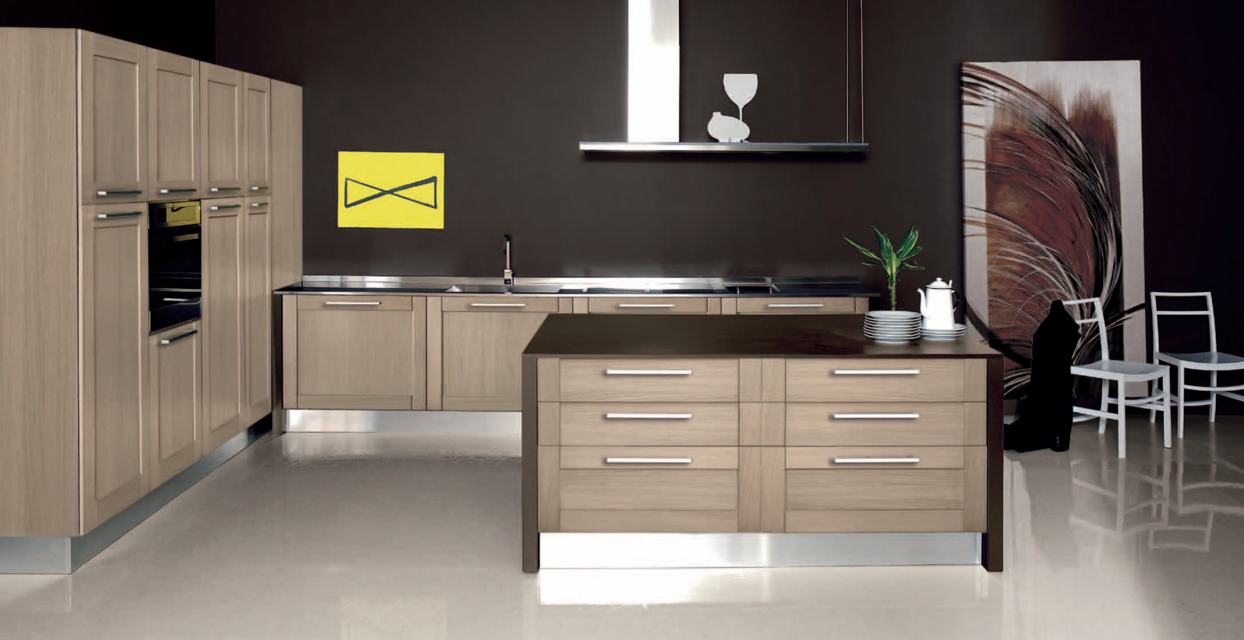
Rovere maranello - Maranello oak - Roble Maranello - Chêne Maranello - Eiche Maranello - пепельный дуб