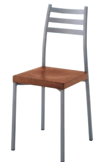
Sedia Excel Excel chair Silla Excel Chaise Excel Stuhl Excel cрын Excel