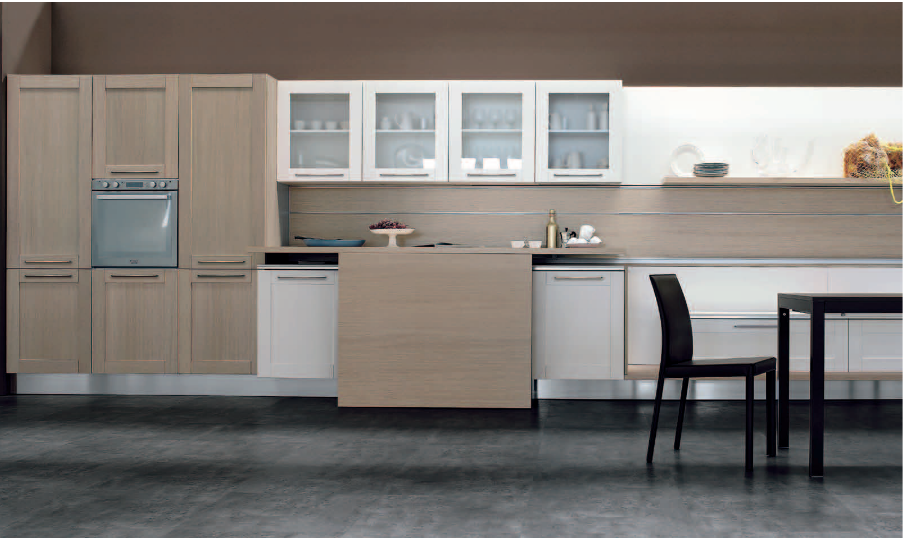
rovere chiaro e rovere bianco semilucido - semi glossy white oak finishes - roble claro y roble blanco semibrillo chêne clair et chêne blanc semi-brillant - Eiche hell und Weiss glanz - в отделке полуглянцевый светлый дуб