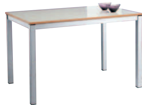
Tavolo Alu Brill Brill Alu table Mesa Alu Brill Table Alu Brill Tische Alu Brill Cron Alu Brill