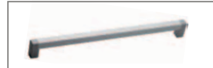
DI SERIE-STANDARD-DE SERIE-DE SERIE-STANDARD СЕРИЙНЫЕ Alluminio - Aluminium - Aluminio Aluminium - Aluminium - Алюминий