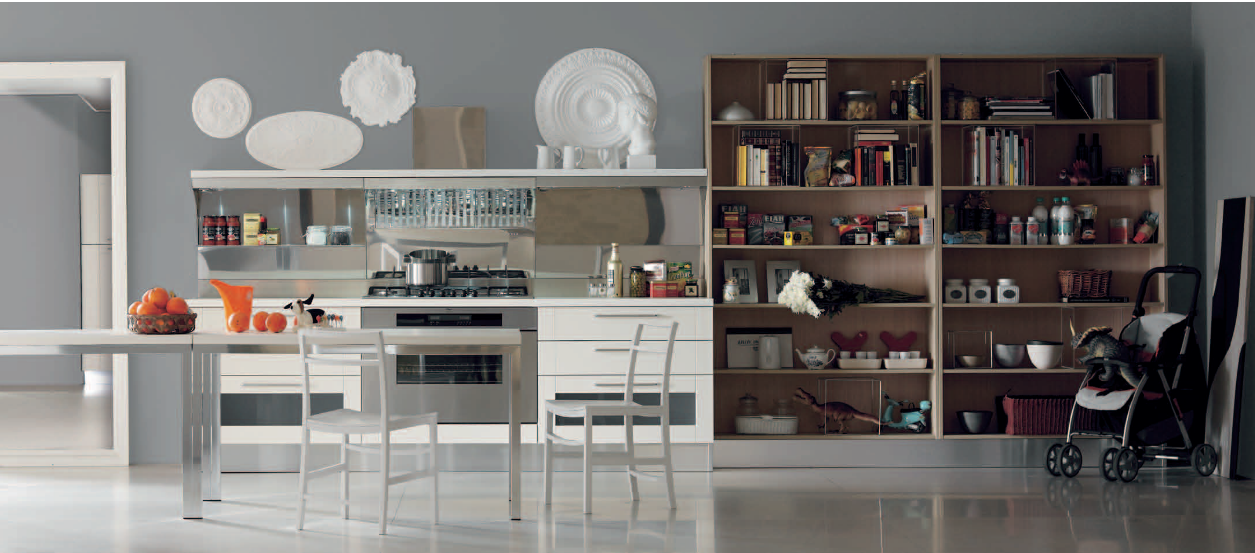
rovere avorio e rovere chiaro - ivory oak and light oak - roble marfil y roble claro - chène ivoire et chène clair Eiche elfenbeinfarbe und Eiche hell - дуб слоновая кость и светлый дуб