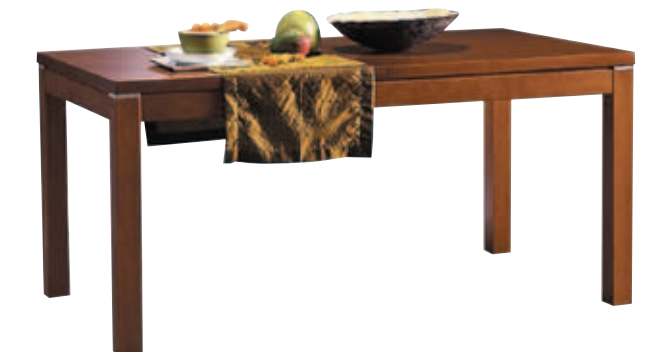
Tavolo Excel Excel table Mesa Excel Table Excel Tische Excel Cron Excel