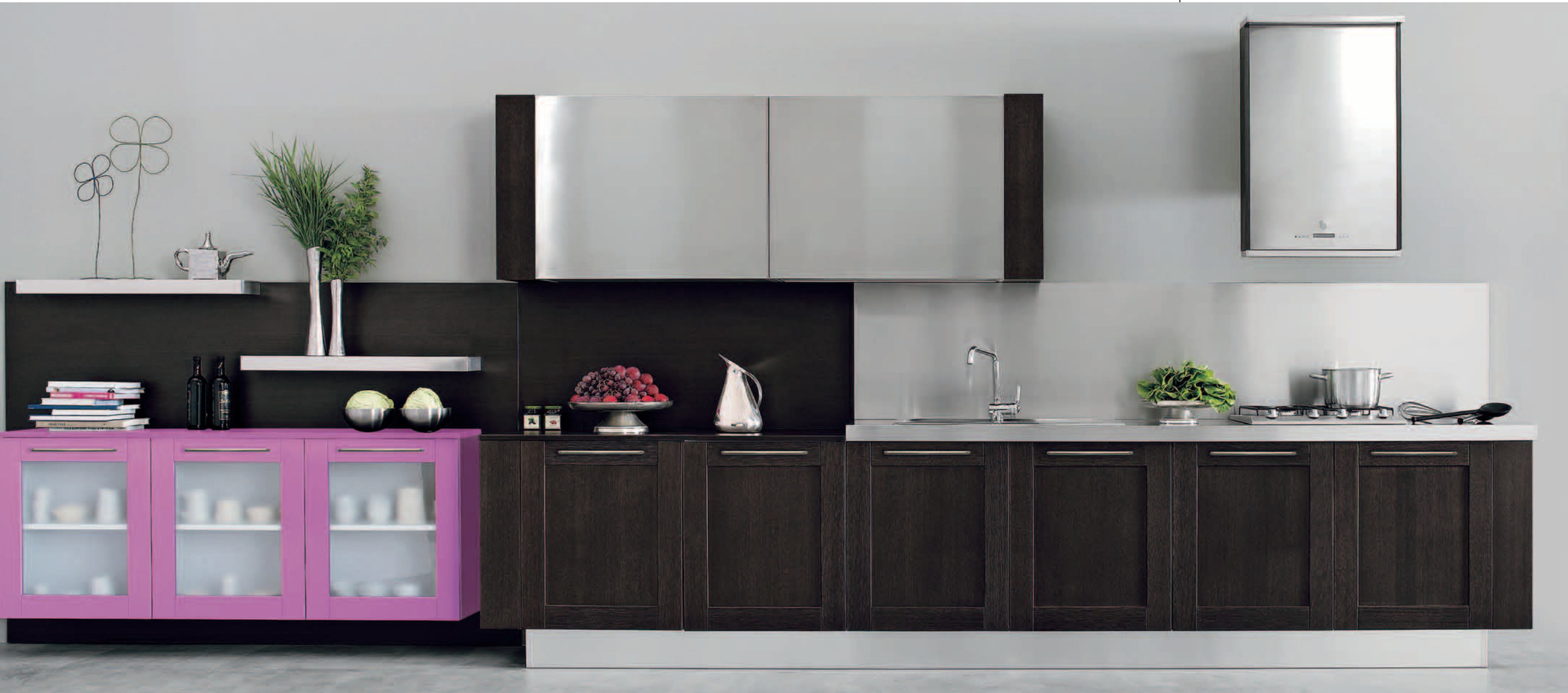
rovere lilla e rovere scuro - lilac oak and dark oak - roble lila y roble oscuro - chêne lille et chêne foncé Eiche lilac und Eiche dunkel - сиреневый дуб и тёмный дуб